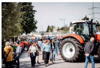
Ein vielfältiges Programm wird für die Besucher wieder in Wieselburg geboten.

Von 28. bis 31. Mai 2026 wird das Messegelände Wieselburg erneut zum Treffpunkt der Branchen Land-, Forst- und Jagdwirtschaft. Unter dem Motto „LIVE Erleben!“ ist der Test-Parcours wieder fixer Bestandteil und ermöglicht praxisnahe Tests. Im Bereich Land- und Forsttechnik dürfen sich Besucher auf neue technologische Lösungen freuen.