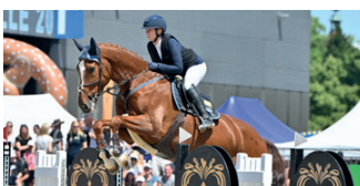
Springturnier bei der Messe Pferd Wels.

Power of Emotions“. Mehr unter: pferd-wels.at Werbung