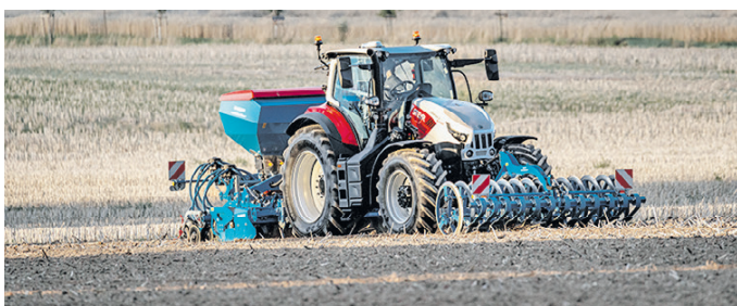
Der Steyr Impuls CVT wird ebenso präsentiert.