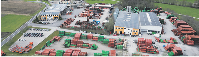
Bauernfeind mit hauseigenem Fuhrpark.