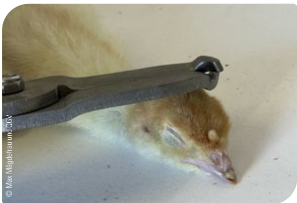
Abb. 20: Betäubung mittels Schlag auf den hinteren und oberen Bereich des Kopfes

und oberen Bereich des Kopfes, knapp hinter dem höchsten Punkt des Kopfes.