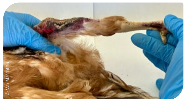
Abb. 8: Großflächige Verletzung des Ständers

ERKENNUNG VON KRANKEN UND VERLETZTEN TIEREN, VERSORGUNG BEI KRANKHEIT, GRÜNDE DER NOTTÖTUNG