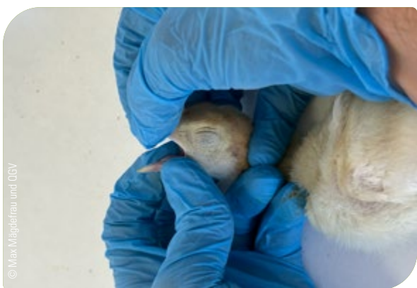
Abb. 21: Überprüfung der Betäubung: Das Öffnen des Schnabels muss ohne spürbaren Widerstand gelingen

Bei zweifelhafter Betäubung muss diese sofort wiederholt werden!