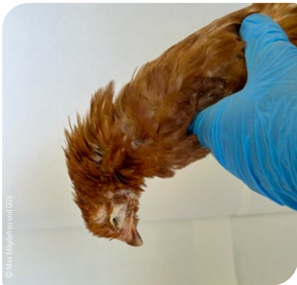
Abb. 14: Überprüfung des Todes: schlapp herabhängender Körper

Der Tierkörper darf erst dann entsorgt werden, wenn der Tod sicher eingetreten ist und überprüft wurde!