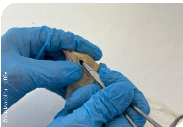
Abb. 23: Überprüfung des Todes: Die geöffneten Augen werden mit einem spitzen Gegenstand berührt. Das Tier darf keine Reaktionen zeigen

Der Tierkörper darf erst dann entsorgt werden, wenn der Tod sicher eingetreten ist und überprüft wurde!