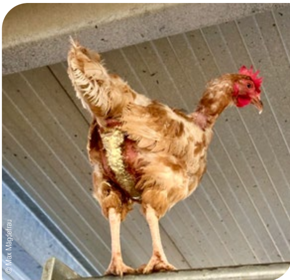
Abb. 3: Hochgradiger Ausfluss aus Kloake aufgrund Eileiter-, Bauchfellentzündung