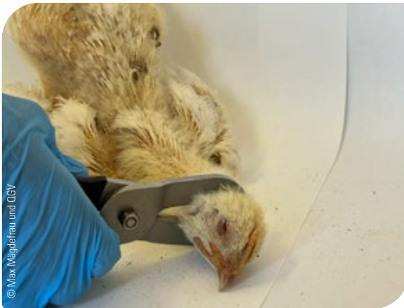
Abb. 17: Tötung durch Genickbruch mittels Geflügelzange