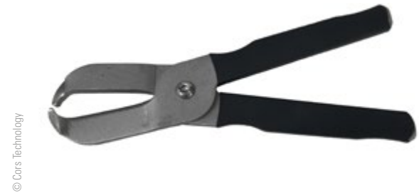
Abb. 13: Geflügelzange bis 3 kg, Bedienungsanleitung: https://www.cors.technology/download-center/