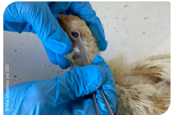
Abb. 19: Überprüfung des Todes: Bei Berührung des Auges mit einem spitzen Gegenstand zeigt das Tier keine Reaktion