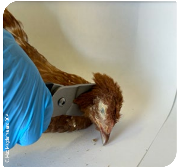
Abb. 12: Tötung durch Genickbruch mittels Zange