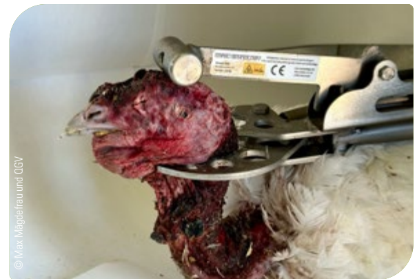
Abb. 24: Betäubung mit Schlagbolzen