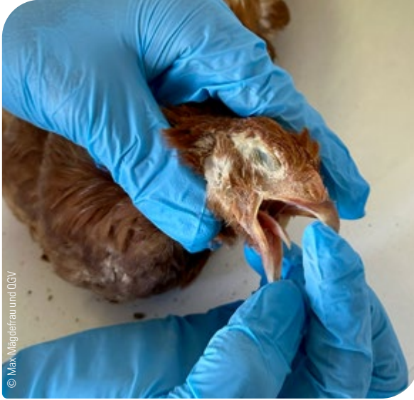
Abb. 11: Überprüfung der Betäubung: Das Öffnen des Schnabels mit den Fingern muss ohne Widerstand möglich sein

Danach muss unverzüglich, jedenfalls aber innerhalb einer Minute, die Tötung des Tieres erfolgen.