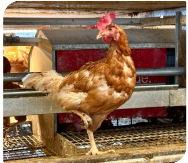
Abb. 5: Fraktur des rechten Ständers