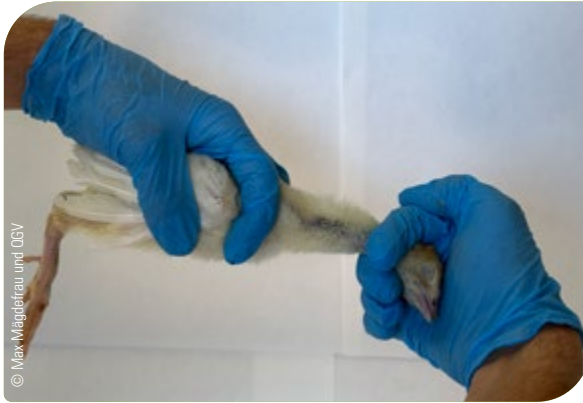
Abb. 22: Tötung: Genickbruch durch Strecken des Halses