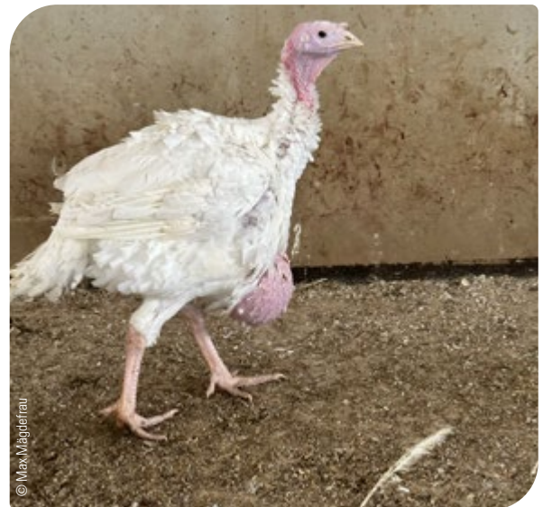
Abb. 7: Herabhängender Kropf mit Kropfverstopfung