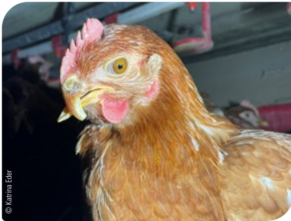
Abb. 2: Kreuzschnabel

Beispiele von Verletzungen, Erkrankungen und Missbildungen bei Tieren, die entweder versorgt oder notgetötet werden müssen: