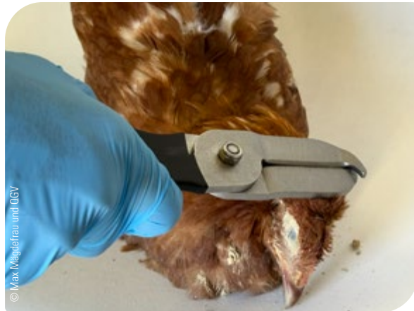
Abb. 10: Betäubung mit der Geflügelzange durch einen festen und präzisen Schlag auf den Hinterkopf