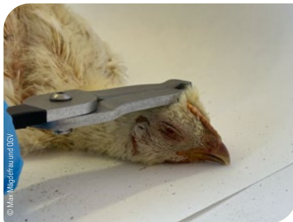
Abb. 15: Betäubung mittels Geflügelzange

Danach muss unverzüglich, jedenfalls aber innerhalb einer Minute, die Tötung des Tieres erfolgen.