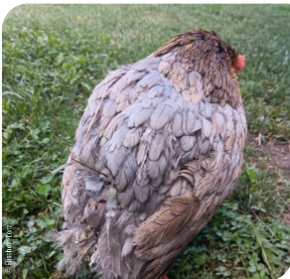
Abb. 4: Verminderter Allgemeinzustand: aufgestellte Nackenfedern, Tier lässt Flügel und Kopf hängen