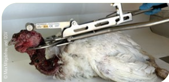
Abb. 26: Zange nach der Betäubung zügig und mit genügend Druck schließen