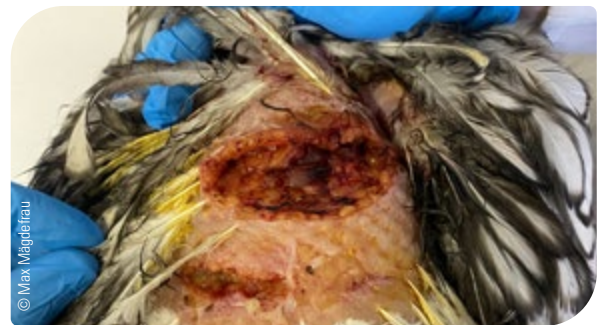
Abb. 6: Hochgradige Bissverletzung nach Fuchsangriff