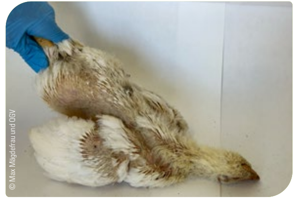
Abb. 18: Überprüfung des Todes: schlaffer Körper, lose herunterhängende Flügel

Der Tierkörper darf erst dann entsorgt werden, wenn der Tod sicher eingetreten ist und überprüft wurde!