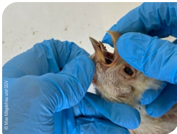
Abb. 16: Überprüfung der Betäubung: Das Öffnen des Schnabels mit den Fingern muss ohne Widerstand möglich sein