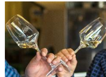
Qualitätsmoststielglas 0,25 l