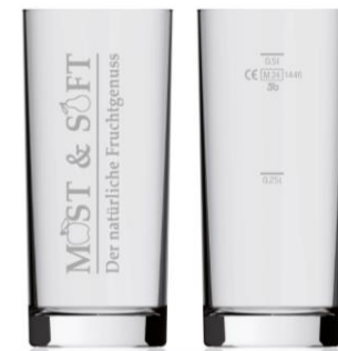
Longdrinkglas Most & Saft 0,5 l