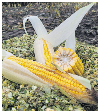
Erfolgreicher Anbau mit Sorten von KWS Austria.

Cabalio RZ ~260: Die ertragsstärkste neue Maissorte im frühen Reifebereich punktet mit sehr guter Jugendentwicklung und mittelhohem Wuchs. Ihre Doppelnutzungseigenschaften überzeugen Körnermais- und Silomaislandwirte gleichermaßen. Diese Überlegenheit wurde