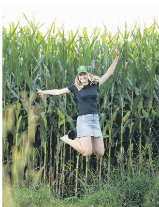
Erfolgreich anbauen mit Pioneer.

Die auf herkömmliche Weise gezüchteten Hybriden wie Optimum AQUAmax P7818 RZ 260, P8604 RZ 260, P8754 RZ 270, P8436 RZ 310, P8834 RZ 330, P92440 RZ 350 neu, P9610 RZ 370, P9944 RZ 430, P0725 RZ ca. 430 und neu P0710 RZ ca. 430