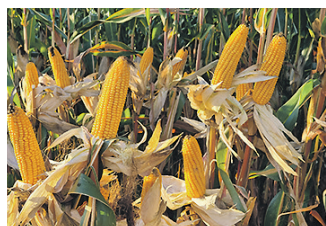
Cabalio: Ertragstärkste neue Maissorte im frühen Reifebereich.

Die Dominanz dieser Doppelnutzungssorte wurden in den Versuchen der Agrana, als auch der LK OÖ sowohl im Körnermais- als auch im Silomaisbereich eindrucksvoll bestätigt. Cabalio ist der 6fach-Sieger in den offiziellen Versuchen 2024.