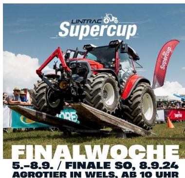
Bildtext: Lintrac Supercup

Mit dem Partner Lindner Traktoren steigt am 8.9. das große Finale des Lintrac Supercup. Von 5. bis 8. September steht das Racing im Mittelpunkt der AgroTier in Wels. Nach drei anspruchsvollen Qualifikationstagen findet am Sonntag das große Finale statt. Der Gesamtsieger erhält einen 5.000 Euro Gutschein für eine Fahrzeugmiete aus der Lindner-Flotte.