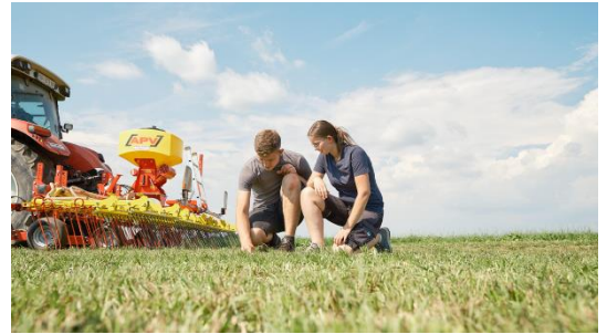
Bildtext: AgroTier

Aussteller: Schauer Agrotronic, Hörmann, Wolf, Bräuer, STEWA, Schaumann, Praxmayer, Multikraft, Lely, DeLaval, GEA