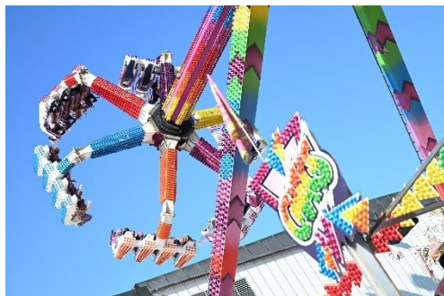
Bildtext: Welser Volksfest

Im Festzelt „Zum Ludwig“ geht die Post ab – rustikal, gemütlich und mit jeder Menge Stimmung! Hier werden regionale Schmankerl geschlemmt und gefeiert bis zum Abwinken. Von deftigem Brat'l bis zur süßen Nachspeise! Mit dem Line-up im Festzelt kocht die Stimmung über. Wenn diese Bands loslegen, bleibt keiner auf den Bänken sitzen: