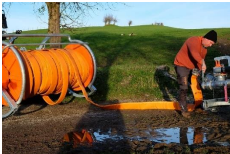
Bildtext: Güllepark

Namhafte Hersteller zeigen ihre Lösungen rund um die Gülleaufbereitung, Separation bis hin zur nährstoffeffizienten Ausbringung mit Güllefass, Gülleverschlauchung und Selbstfahrer mit Schleppschlauch, Schleppschuh und Injektor. Dazu wird der Maschinenring OÖ täglich um 14:00 Uhr mit weiteren Experten die entscheidenden Punkte in der Gülleverfahrenstechnik vorstellen.