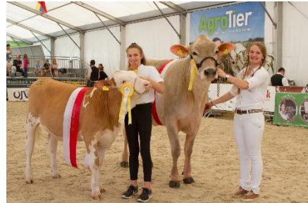
Bildtext: Tiervorführungen