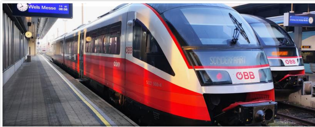
Bildtext: Sonderzug

Alle erwachsenen Besucher der Messe, die mit den Öffis anreisen und vor Ort beim Kauf der Messe-Eintrittskarte an der Kasse ihr Öffi-Ticket vorweisen, erhalten während der gesamten Messelaufzeit den ermäßigten Eintrittskartenpreis von 11,00 Euro statt 13,00 Euro.