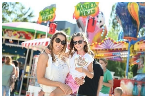
Bildtext: Familiennachmittag

Im Vergnügungspark geht's rund und hoch hinaus! Hier warten Schaubuden und Fahrgeschäfte auf euch, die jedes Herz höherschlagen lassen. Vom waghalsigen Break Dance über das verrückte Tagada bis hin zum schwindelerregenden Sky Flyer, der einzigartigen Crazy Mouse, dem atemberaubenden Riesenrad und noch vieles mehr – hier kommt jeder auf seine Kosten. Da bleibt kein Haar trocken und kein Lachmuskel unbeanspruchst. Ob groß oder klein, jung oder alt – Spaß und Action sind garantiert!