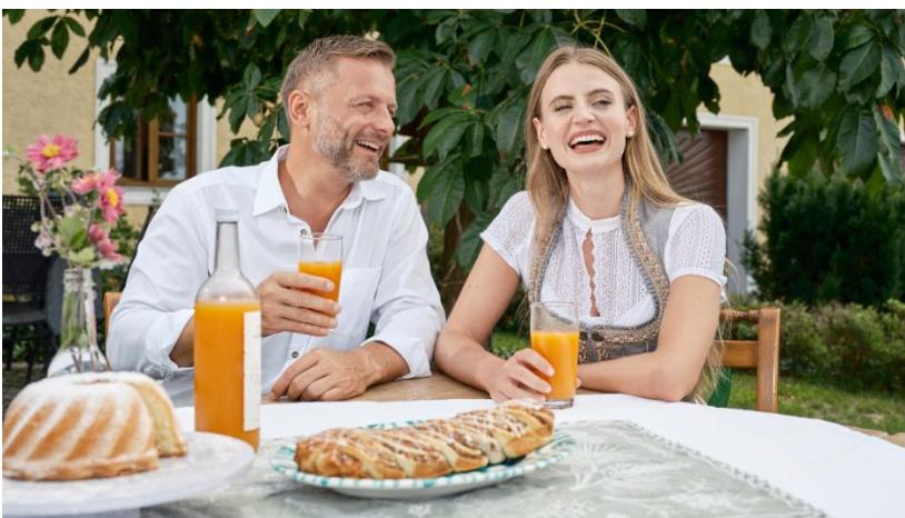
Bildtext: Welser Herbstmesse Bildquelle: Messe Wels