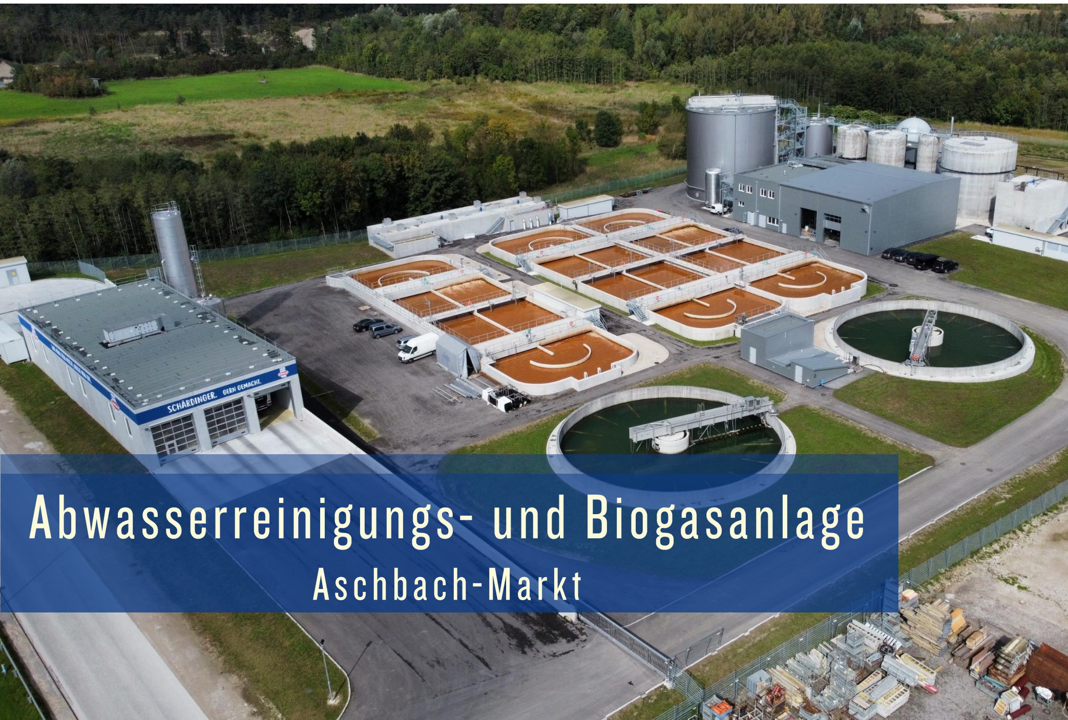
Abwasserreinigungs- und Biogasanlage Aschbach-Markt