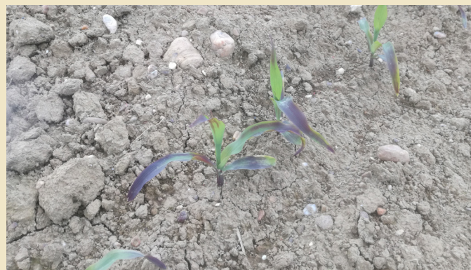
Phosphatmangel: im Jugendstadium benötigt Mais im Wurzelbereich ausreichend Phosphat.

Die Ertragslage ist im mehrjährigen Durchschnitt ohne Berücksichtigung von Ausreißern nach oben (Spitzenerträge) bzw. nach unten (niedrige Erträge zum Beispiel bei Trockenheit, Hagel, ...) zu ermitteln und auch bei der Erstellung des Düngeplanes zu berücksichtigen. Wichtig ist die Ertragsdokumentation. Diese ist gemäß § 8 der NAPV