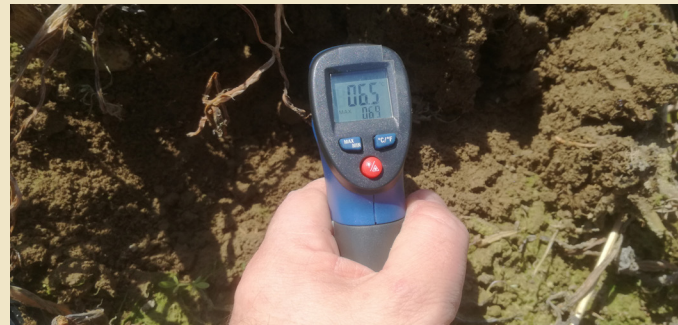
Eine einfache und schnelle Bestimmung der Bodentemperatur.

Mais gilt als robuste, massenwüchsige Pflanze. In der kurzen Wachstumsperiode benötigt er für eine rasche Jugendentwicklung eine optimale Nährstoffversorgung. Rund 75 Prozent der gesamten Nährstoffmenge werden innerhalb eines Monats aufgenommen. Damit unterscheidet er sich wesentlich von anderen Getreidearten. Die Tabelle Nährstoffbedarf der Maispflanze zeigt den Bedarf an Stickstoff, Phosphor und Kali innerhalb verschiedener Wachstumsphasen in Prozent vom Gesamtbedarf.