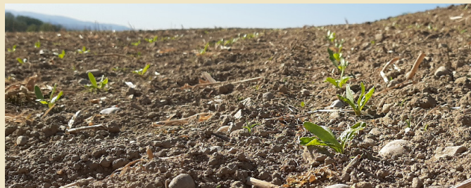
Abbildung 5: Die Mulchsaat schützt vor Erosion sowie Verschlammung und fördert den Erhalt der Bodenstruktur.