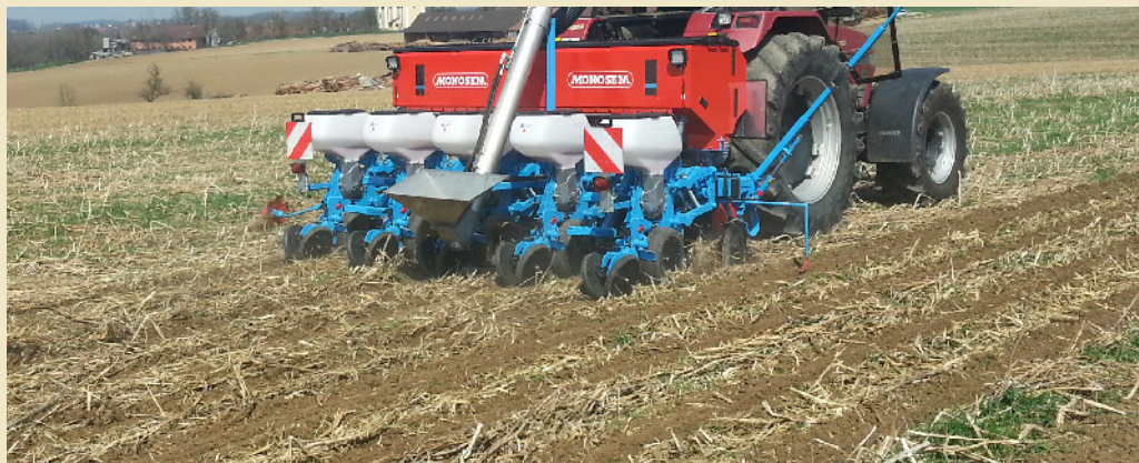
Abbildung 6: Eine passende Bodenbedingung mit der geeigneten Sätechnik ermöglicht die Aussaat direkt in den unbearbeiteten Begrünungsbestand.