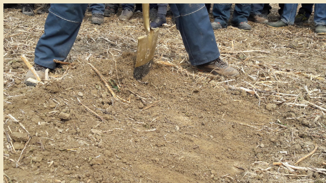
Abbildung 4: Die erste Bodenbearbeitung sollte zur Zerkleinerung der Begrünung und zum Einebnen des Feldes dienen. Auf unnötige Überfahrten sollte aus Gründen wie Wassereinsparung sowie Bodenverdichtung verzichtet werden.