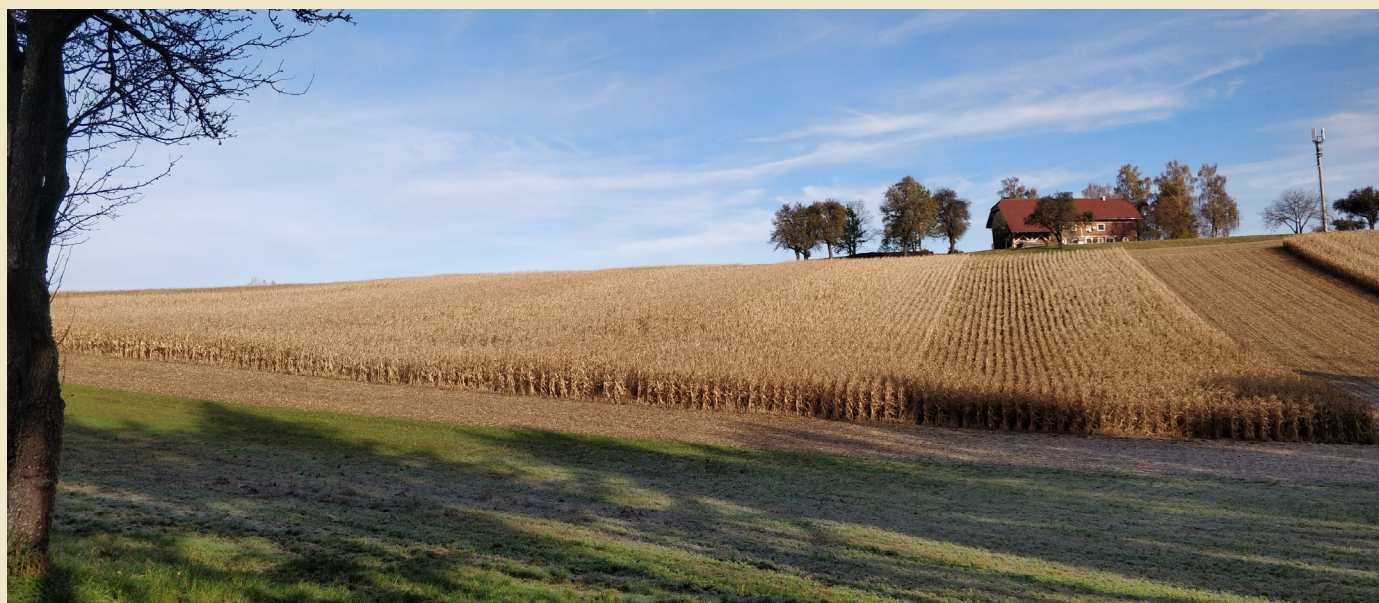
Maissortenversuch am 9. November 2023 zur Ernte.