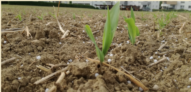
Mais bedarfsgerecht düngen.

Mais hat als wärmeliebende C 4 -Pflanze eine bessere Photosyntheseleistung als andere Kulturpflanzen, das spiegelt sich in einem hohen Ertragspotenzial wider. Um das Potenzial bestmöglich zu nutzen, sind neben der Witterung auch die pflanzenbaulichen Maßnahmen entscheidend.