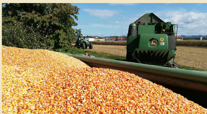
Günstige Trocknungskosten bei Mais erhöhen dessen Wirtschaftlichkeit gegenüber Soja.