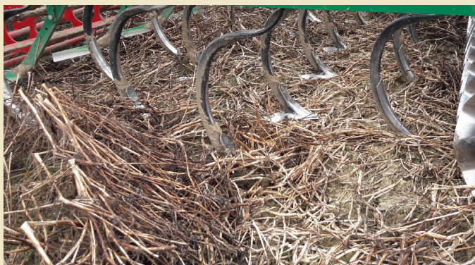
Abbildung 2: Eine schlagkräftige, flache Bodenbearbeitung im Frühjahr sollte den Begrünungsbestand zerkleinern und das Feld einebnen.