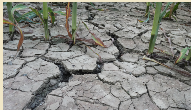
Kaliummangel: Kalium ist besonders bei extremen Verhältnissen von Bedeutung.