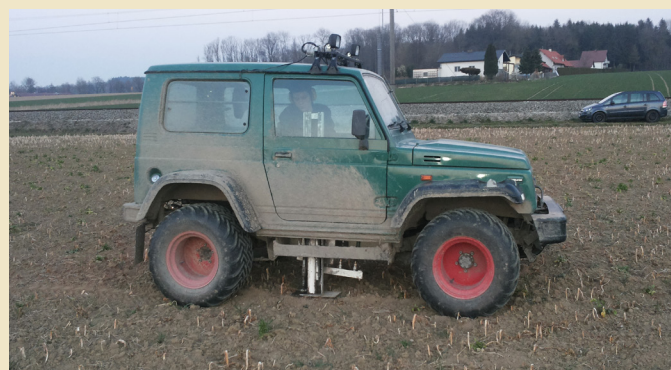
Im Rahmen des Nitratinformationsdienstes werden auch heuer wieder Mitte März N_{min} -Bodenproben von 0 bis 30 Zentimeter, 30 bis 60 Zentimeter und 60 bis 90 Zentimeter Bodentiefe gezogen.

Die nachfolgende Tabelle der NAPV 2023 enthält die Düngeobergrenzen je nach Ertragslage. Diese sind seit 1. Jänner 2023 gültig und einzuhalten. Zu beachten ist die 10-prozentige N-Reduktion