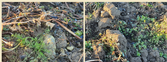
Abbildung 3: Kamille und Ehrenpreis sind Problemunkräuter und entwickeln sich bereits im Herbst bei schlechter Bodenbedeckung der Zwischenfrucht.