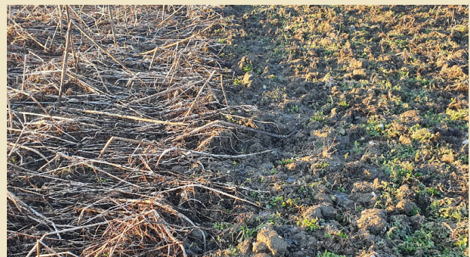
Abbildung 1: Verschiedene Aussaatzeitpunkte und Aussaatverfahren bei Begrünungen zeigen klare Unterschiede im Abfrosten und in der Unkrautunterdrückung.

Ein früherer Aussaatzeitpunkt der Zwischenfrucht Anfang August (Abbildung 1,