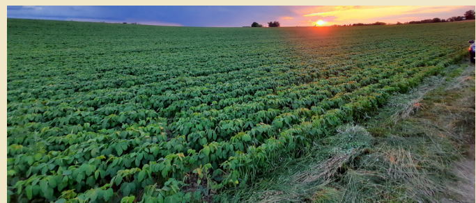
Lichtblicke zur Entscheidung „Mais oder Soja“ können diese Berechnungen darstellen.

Sojabohnen (ohne öffentliche Ausgleichszahlungen, ...) von rund 650 Euro je Hektar.