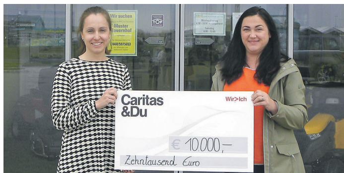
Übergabe der Spende an die Caritas.