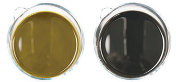
ohne VTA Biodol®