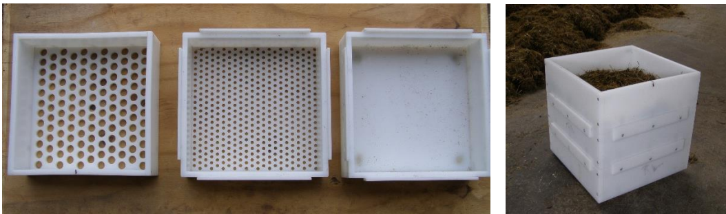
Obersieb 19 mm Mittelsieb 8 mm Siebboden

Die Schüttelbox besteht aus 3 oder 4 Teilen, wobei in der Praxis die 3-teilige Variante ausreicht.