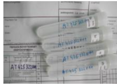
Beschriftung der Röhrrchen