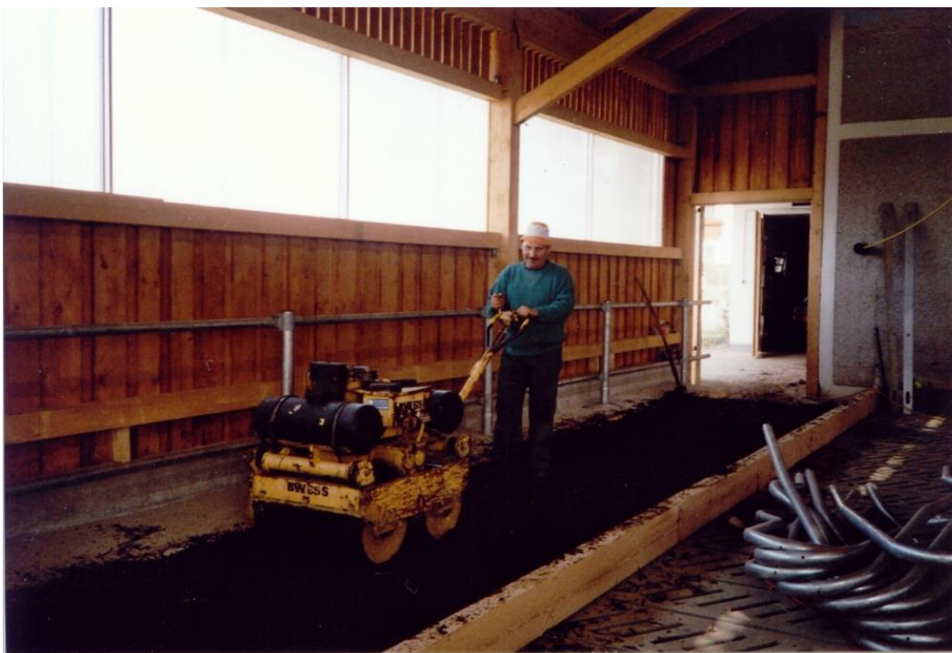
Wichtig: Bei der Neuanlage den Mist gut festwalzen!