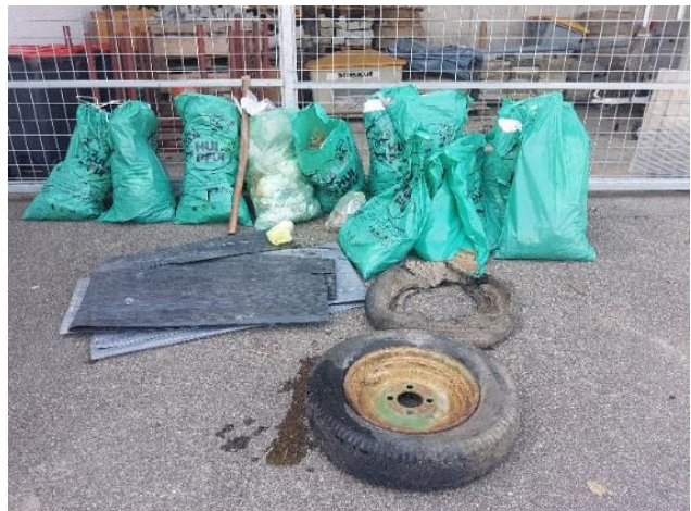
Weggeworfener Müll, der von Volksschülern im Bezirk Perg gesammelt wurde.

Es gilt Verantwortung zu übernehmen bei der Produktherstellung bis hin zur Verpackung und Entsorgung. Kreislaufwirtschaft muss lineare Entsorgungswege ersetzen. Durch intelligentes Produktdesign, mehr Recycling und Wiederverwendung soll der Kreislauf der Produktlebenszyklen zunehmend geschlossen und eine wirksamere Wertschöpfung und Nutzung aller Rohstoffe, Produkte und Verringerung der Abfälle erreicht werden. „Es sollte auch immer überlegt werden, welche Produkte im offenen Verkauf angeboten werden können. Deswegen begrüßen wir die Initiativen der Landwirtschaftskammer OÖ, Direktvermarkter und Konsumenten verstärkt in Richtung Verpackungssensibilität zu schulen“, betont Roland Wohlmuth.