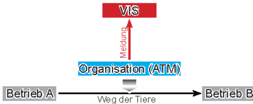
Abbildung 6: „Betrieb A“ liefert Tiere an „Betrieb B“, wobei diese Verbringung über eine Organisation (ATM) abgewickelt wird. Die Meldung erfolgt nur durch die ATM (Organisation).

Wurde das Tier bei einer Versteigerung gekauft, so erfolgt die Meldung durch den Zuchtverband als „Autorisierte“ Meldestelle (ATM). Verbringungen, die von einer ATM gemeldet werden, müssen vom Meldepflichtigen nicht nochmals direkt an das VIS übermittelt werden. (Muss Käufer Zugang melden?)